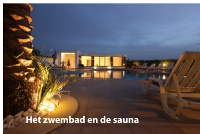
Het zwembad en de sauna