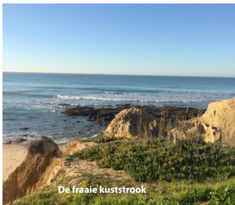
De fraaie kuststrook